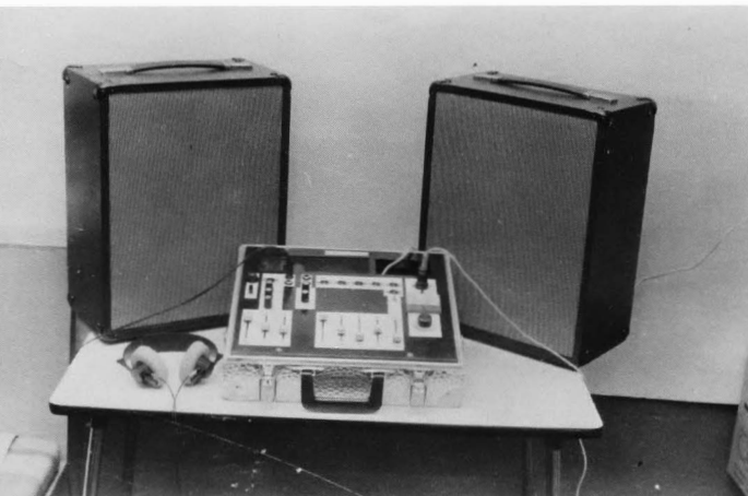
Z.g. „lijnset“; hiermee zijn verbindingen van ziekenhuis naar studio en vandaaruit rechtstreeks naar andere ziekenhuizen mogelijk.

ding op zondag plus een programma van geestelijke muziek. Op de zaterdagmiddag is er een kinderuitzending, terwijl er 's ochtends een programma voor Turkse luisteraars is. Tenslotte zijn er iedere avond twee korte uitzendingen, waarin aktueel nieuws uit Apeldoorn te beluisteren is. Deze service is tot stand gekomen dank zij de medewerking van de Nieuwe Apeldoornse Courant. Alles bij elkaar schat men, dat dat zo'n 150 mensen dagelijks naar de uitzendingen luisteren.