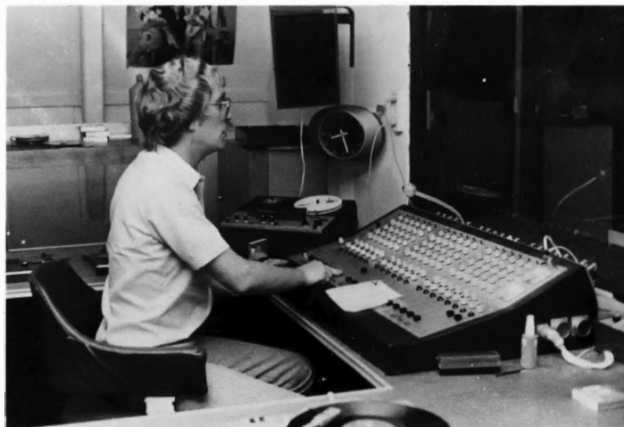
Studio, waar o.m. de life-uitzendingen verzorgd worden.

De Zonnegolf streeft ernaar, de patiënt zoveel mogelijk actief in te schakelen bij het tot stand komen van programma's, die op de verpleegafdelingen zelf worden gemaakt. Naast de eigen inbreng van de patiënt, zal met name de medewerking van de verpleging van groot belang blijken te zijn voor het slagen van zo'n projekt. De vrijwillige inspanningen van de Zonnegolf-medewerkers verdienen het in ieder geval.