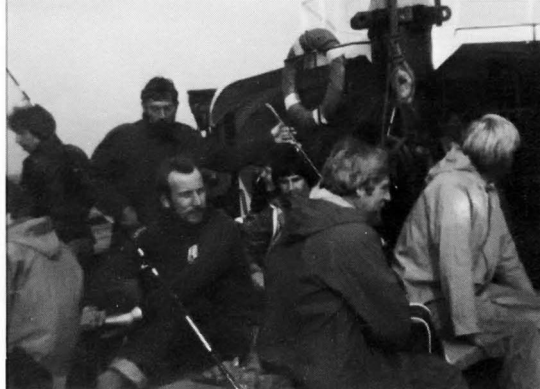
Op de heenreis was het nog koud maar men was klaar voor het grote werk.